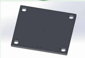
最大サイズ400×1000まで対応可能